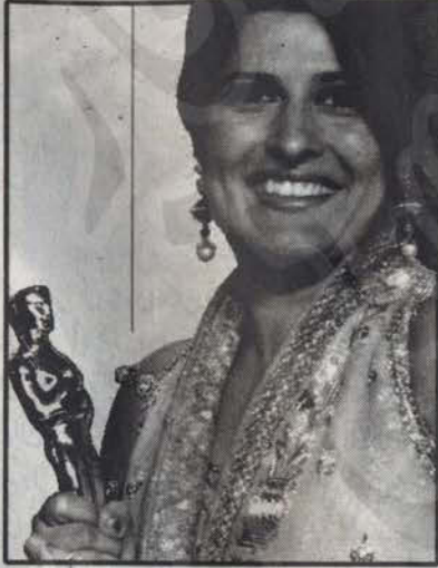
کوزے میں دریا بننا

شوہز کی دنیا میں کئی اشارے ایسے ہیں جن کے بارے میں کہا جاسکتا ہے کہ وہ آئے، انہوں نے دیکھا اور رخ کر لیا، ان ہی لوگوں میں ایک نام ہمایوں سعید کا ہے، ہمایوں نے ایک چھوٹے رول سے نی وی پرائز کی اور دیکھتے ہی دیکھتے شہرت کی بلندیوں پر جا پہنچے۔ ہمایوں سعید اس وقت نہ صرف اداکاری بلکہ اپنی پروڈکشن کے حوالے سے مالا مال اس خوبصورت فنکار نے اداکاری کے میدان میں غضب کی جدوجہد کی اور کامیابی کے جھنڈے گاڑے ہیں۔